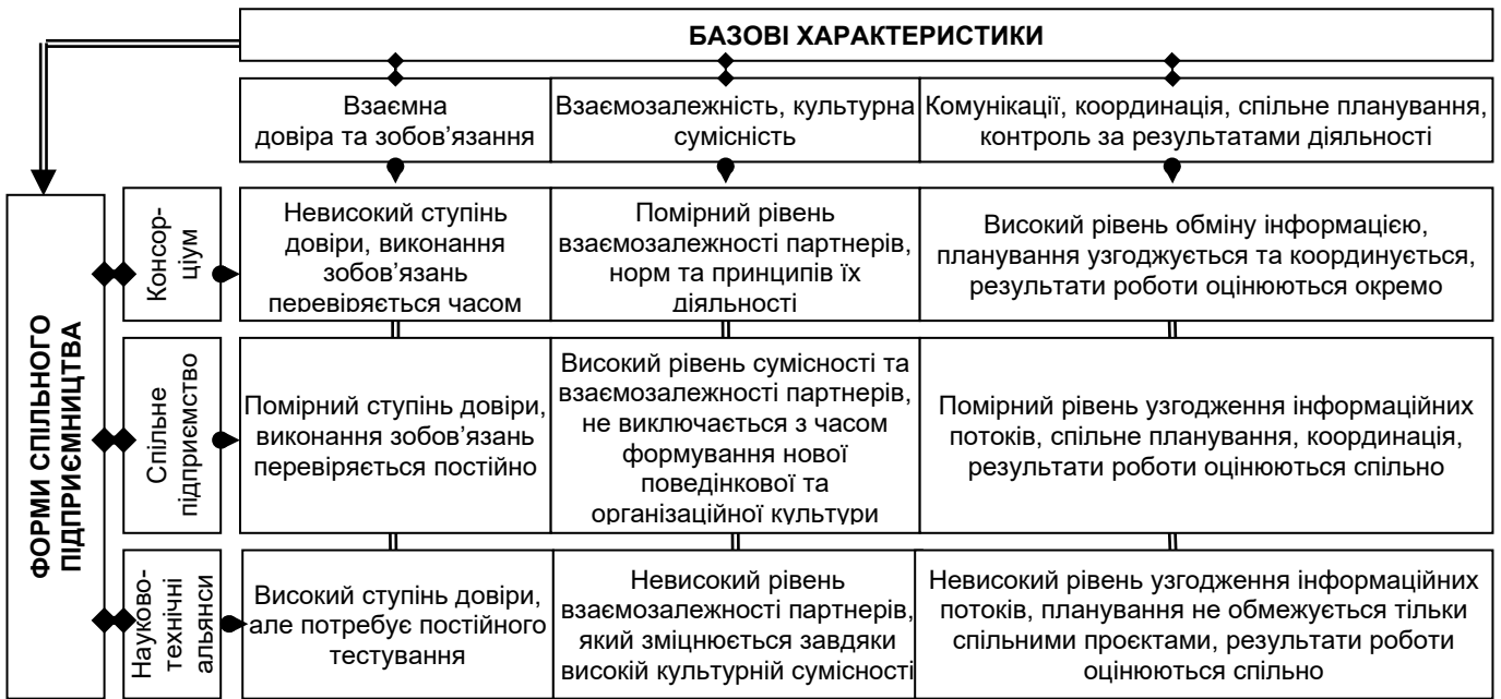
Рисунок 1. Характеристики ефективної форми спільного підприємництва Джерело: [5; 6; 12].