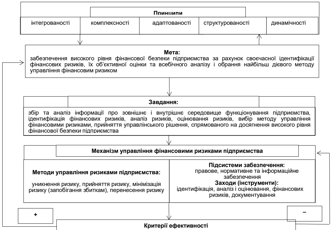
Рисунок 2. Концептуальні засади управління фінансовими ризиками підприємства в системі його фінансової безпеки

Висновки. Ефективна система управління фінансовими ризиками підприємства в умовах нестабільності та трансформаційних змін позитивно впливає на його фінансово-господарську діяльність. Така система передбачає комплекс заходів щодо зменшення негативного впливу фінансових ризиків на результати діяльності господарюючого суб'єкту й забезпечує високий рівень його фінансової безпеки. Адже, щоб мінімізувати негативні наслідки зовнішнього економічного середовища, підприємствам у ході здійснення діяльності інколи необхідно приймати доволі нетрадиційні рішення. Крім того, важливо своєчасно виявляти можливі фінансові ризики й уважно підходити до оцінки їх можливих наслідків, щоб ухвалювати ефективні управлінські рішення задля уникнення фінансових втрат та негативних наслідків для підприємства.