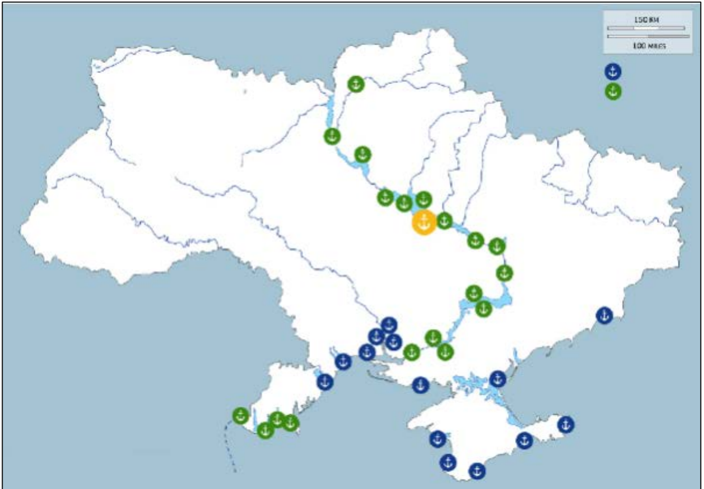
Рисунок 1. Схема розміщення морських і річкових портів на логістичному полігоні України

Припустивши, що \xi_x = 0,15 і, відповідно P_x = 0,85 , за вказаною формулою була визначена кількість експертів, яких планувалося залучити до анкетування. Вона склала 18 осіб.