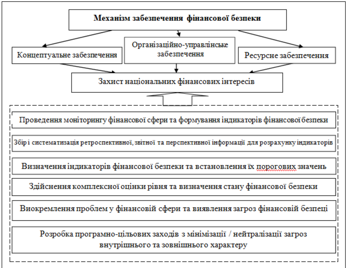
Рисунок 2. Механізм забезпечення фінансової безпеки

У теорії та практиці існує кілька методів оцінки рівня фінансової безпеки. І. О. Бланк пропонує аналізувати фінансову безпеку підприємства, використовуючи порівняльний аналіз, вертикальний аналіз, горизонтальний аналіз, аналіз фінансових коефіцієнтів (фінансова стійкість, оборотність активів, платоспроможність, оборотність капіталу та аналіз прибутковості), а також комплексний фінансовий аналіз (комплексна система аналізу), DuPont. модель, система SWOT-аналізу для аналізу фінансової безпеки, об'єктно-орієнтована система яку застосовують для комплексного фінансового аналізу та аналізу портфеля) [1].