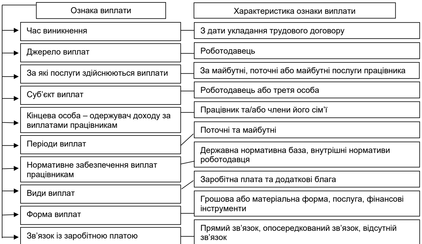
Рисунок 2. Ознаки виплат працівникам [5].

Науковці виділяють наступні характерні ознаки виплат (рис. 2).