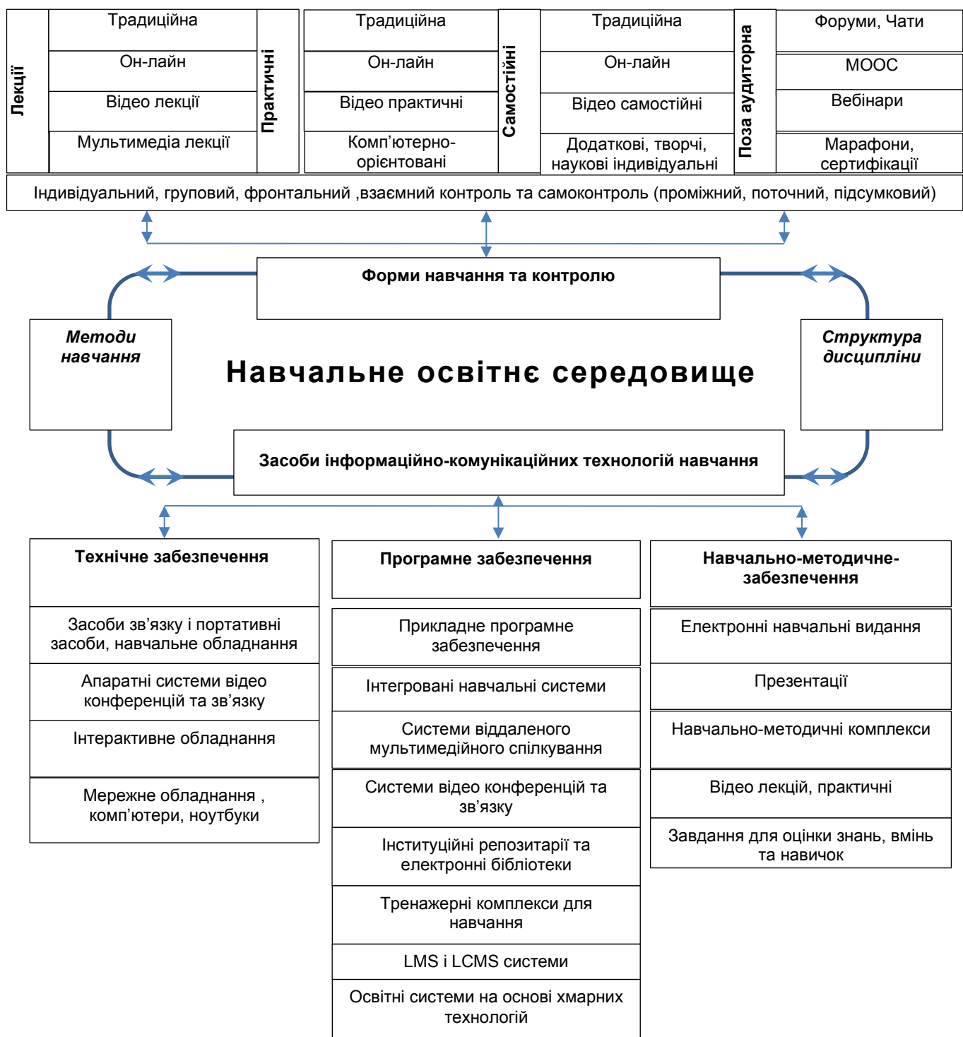
Рисунок 3. Модель освітнього середовища обслуговування процесу викладання економіко-математичних дисциплін засобами інформаційно-комунікативних технологій (власна розробка)

Висновки. В умовах змішаної форми навчання ЗВО спостерігалася тенденція до збільшення використання ІКТ в навчальному процесі. Але якість викладання економіко-математичних дисциплін засобами ІТК потребує вдосконалення, виходячи з досвіду останніх років. Значення економіко-математичних дисциплін в процесі підвищення як загальних так і фахових компетенцій безперечно і до того ж, знання і навички набуті в процесі вивчення таких курсів потребує знань і навичок використання інформаційних технологій. Отже ІКТ виступає і як засіб і як метод навчання. Розглядаючи переваги та недоліки застосування ІКТ в навчальному процесі, аналізуючи педагогічні умови вивчення економіко-математичних дисциплін, беручи до уваги стрімкий розвиток самих інформаційних технологій, ми обґрунтували основні напрями використання ІКТ в процесі вивчення економіко-математичних дисциплін та запропонували педагогічну та організаційну моделі викладання економіко-математичних дисциплін засобами ІТК. Пропозиції, що до вдосконалення технічного,